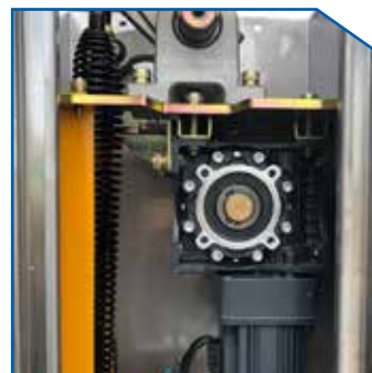
DC Motor 24V DC Motor