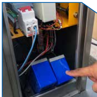
Backup battery keeps barrier running while power off