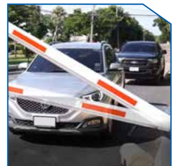
Barrier gate swing out and auto-reverse on obstacle, Protect barrier gate and car.