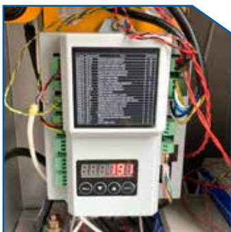
Muti-Function Control System with LED Display