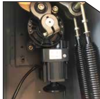
DC Motor 24V DC Motor