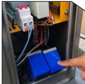
Backup battery keeps barrier running while power off