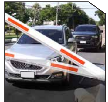
Barrier gate swing out and auto-reverse on obstacle, Protect barrier gate and car.