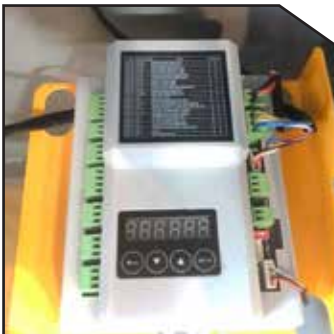
Muti-Function Control System with LED Display